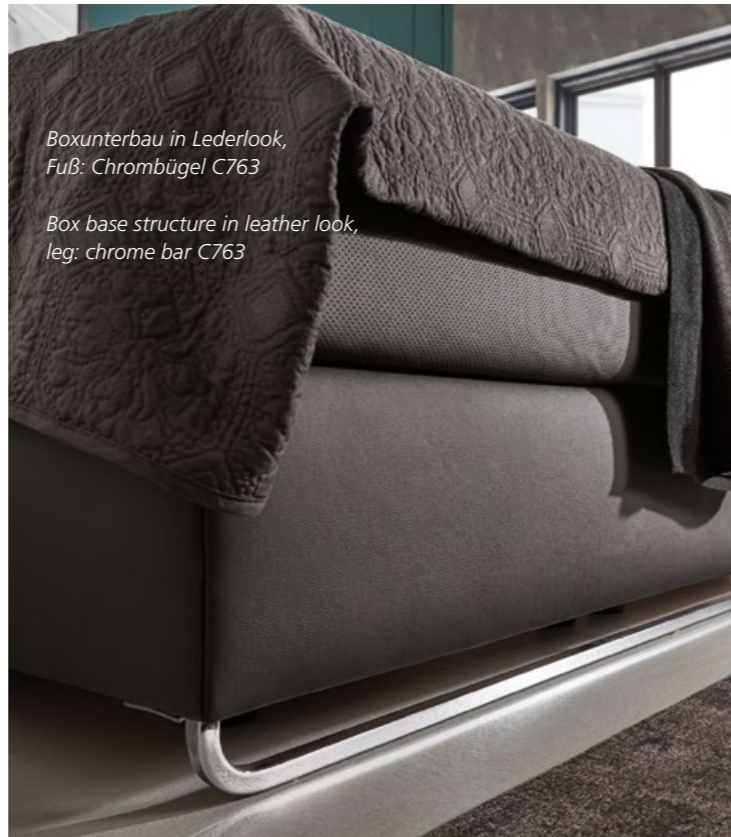
Boxunterbau in Lederlook, Fuß: Chrombügel C763 Box base structure in leather look, leg: chrome bar C763