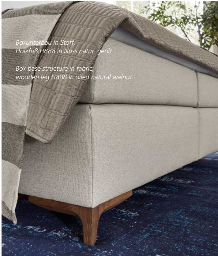
Boxunterbau in Stoff, Holzfuß H888 in Nuss natur, geölt Box base structure in fabric, wooden leg H888 in oiled natural walnut