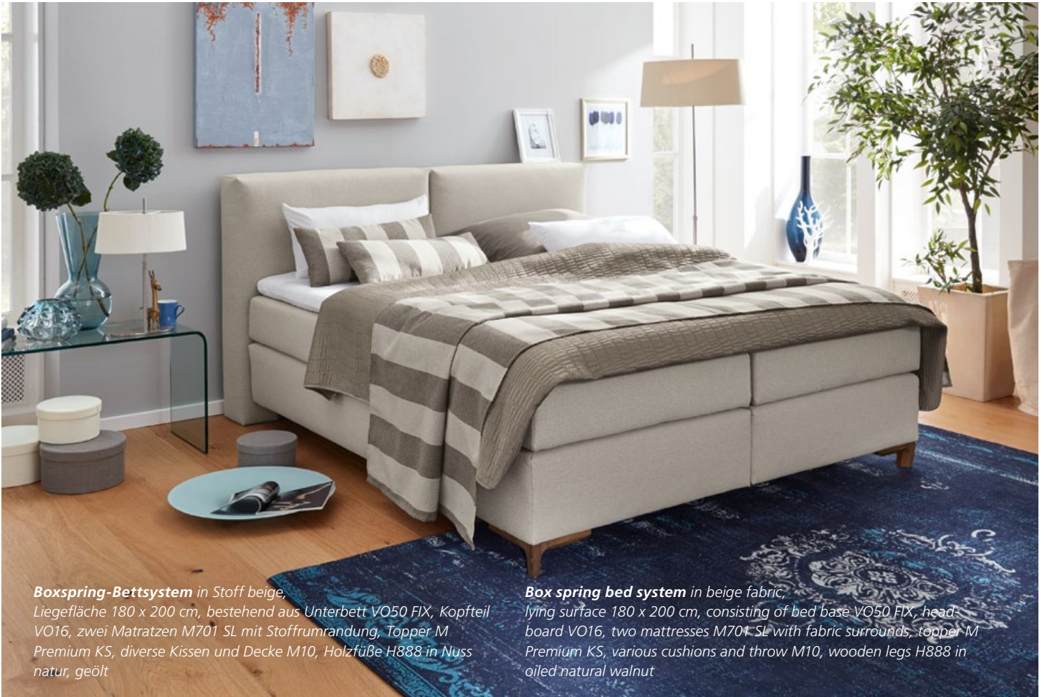
Boxspring-Bettsystem in Stoff beige, Liegefläche 180 x 200 cm, bestehend aus Unterbett VO50 FIX, Kopfteil VO16, zwei Matratzen M701 SL mit Stoffumrandung, Topper M Premium KS, diverse Kissen und Decke M10, Holzfüße H888 in Nuss natur, geölt