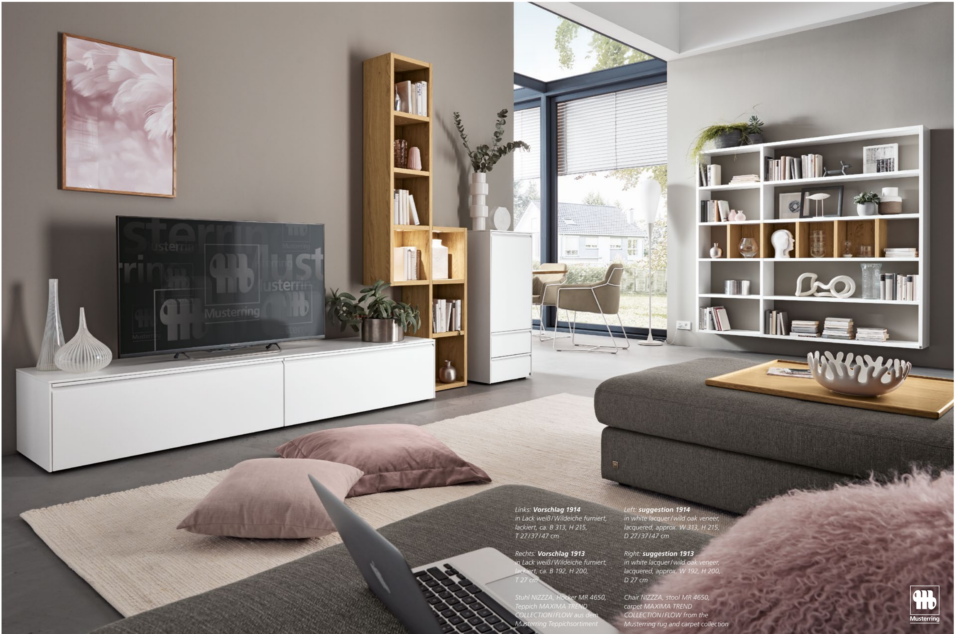
Links: Vorschlag 1914 in Lack weiß/Wildeiche furniert, lackiert, ca. B 313, H 215, T 27/37/47 cm