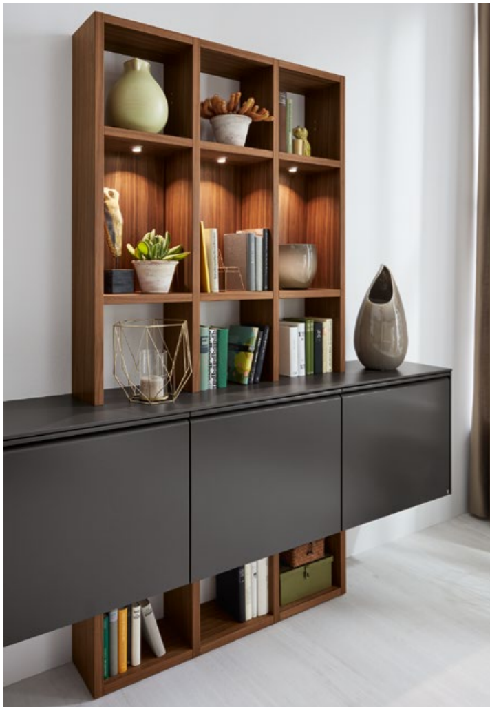
◀ Vorschlag 1908 in Lack anthrazit / Nussbaum satin furniert, lackiert, ca. B 242, H 215, T 20/37 cm