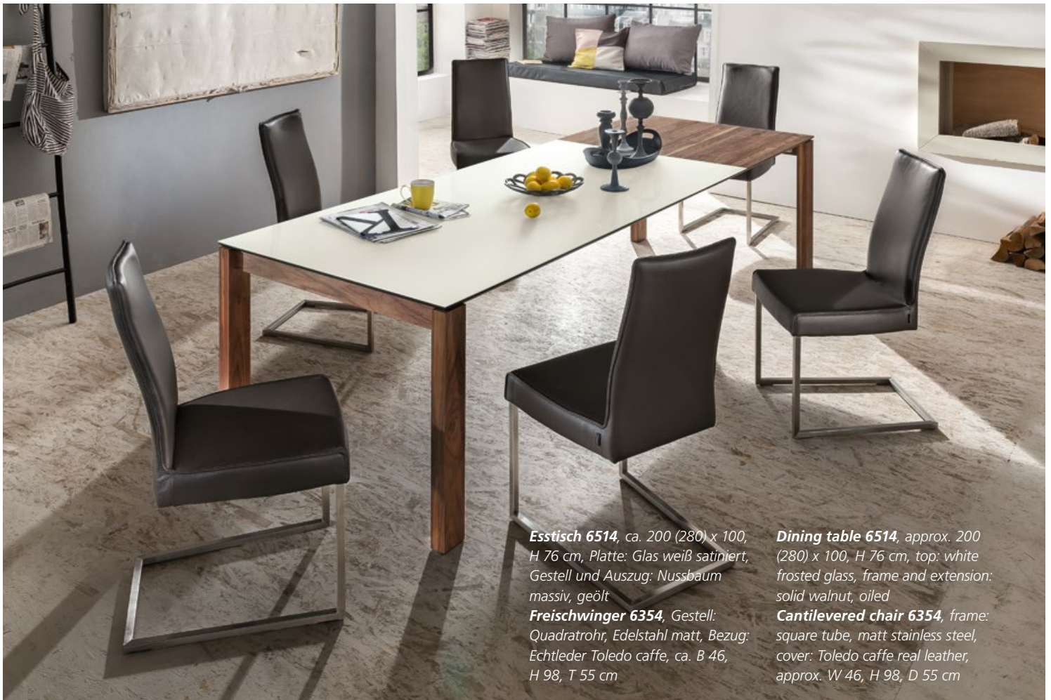
Esstisch 6514 , ca. 200 (280) x 100, H 76 cm, Platte: Glas weiß satiniert, Gestell und Auszug: Nussbaum massiv, geölt Freischwinger 6354 , Gestell: Quadratrohr, Edelstahl matt, Bezug: Echtleder Toledo caffè, ca. B 46, H 98, T 55 cm