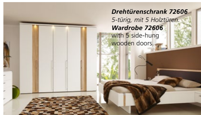
Drehtüreschrank 72606 5-türig, mit 5 Holztüren Wardrobe 72606 with 5 side-hung wooden doors.