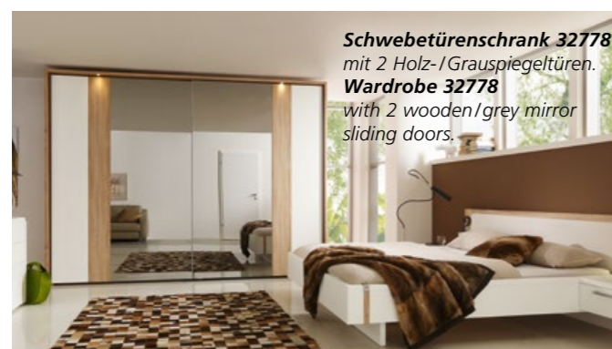
Schwebetüreschrank 32778 mit 2 Holz-/Grauspiegeltüren Wardrobe 32778 with 2 wooden/grey mirror sliding doors.