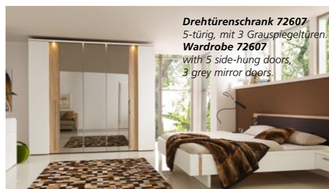
Drehtüreschrank 72607 5-türig, mit 3 Grauspiegeltüren Wardrobe 72607 with 5 side-hung doors, 3 grey mirror doors.