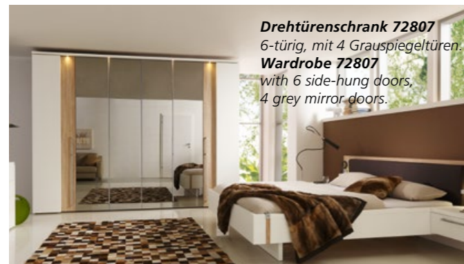
Drehtüreschrank 72807 6-türig, mit 4 Grauspiegeltüren Wardrobe 72807 with 6 side-hung doors, 4 grey mirror doors.