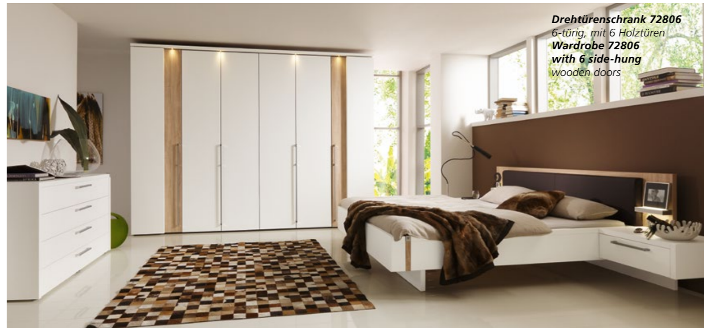
Drehtüreschrank 72806 6-türig, mit 6 Holztüren Wardrobe 72806 with 6 side-hung wooden doors

Chic, elegant, with plenty of variety and practical comfort.