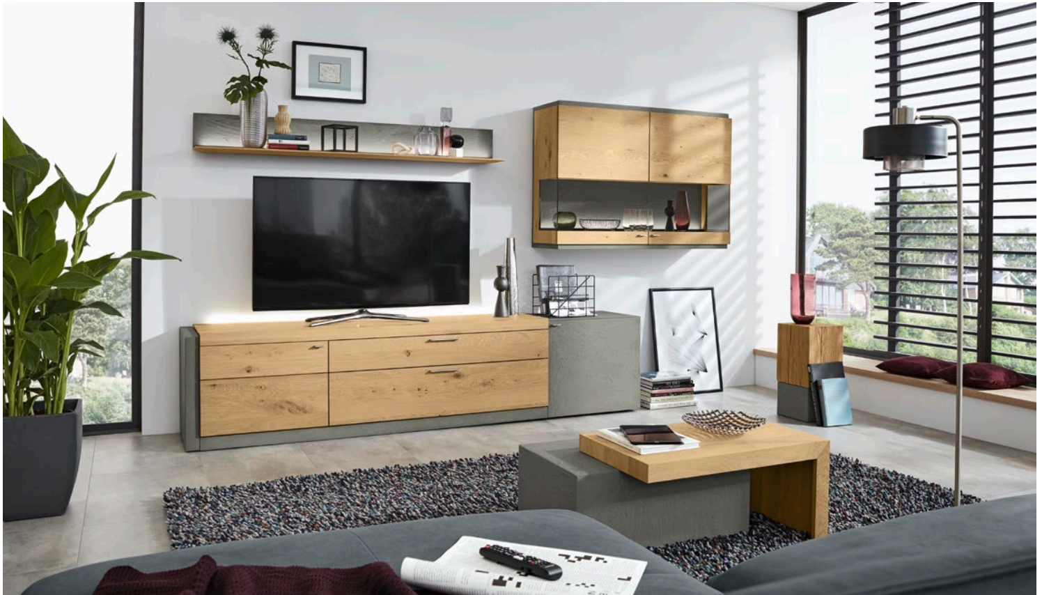
▲ Wohnwand 26 , ca. B 336, H 189, T 49 cm, in Kerneiche natur massiv, Applikation Beton, Couchtisch 0330 , ca. 71x75, H 36 cm, in Kerneiche natur massiv, Applikation Beton