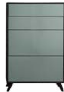
LACK AGAVE // AGAVE LACQUER