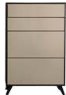
LACK CAPPUCCINO // CAPPUCCINO LACQUER