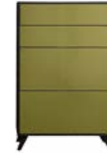
LACK TUNDRA // TUNDRA LACQUER