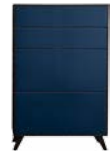
LACK BLAU // BLUE LACQUER