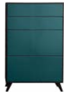
LACK PETROL // PETROL LACQUER