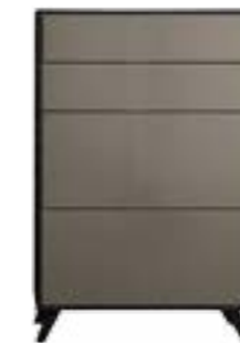
LACK TAUPE // TAUPE LACQUER