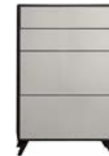
LACK GRAU // GREY LACQUER