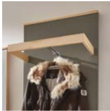
Die Garderobenstange ist harmonisch in das Paneel integriert. // The hanging rail is harmoniously integrated into the panel.

The push-to-open, flush-fitted fronts are a characteristic feature. This creates a minimalist visual effect, which, as here, perfectly combines the core ash carcass with the lacquered taupe fronts. Everything meets the highest functional and quality standards.