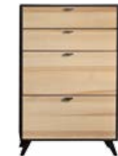
KERNESCHE* // CORE ASH*