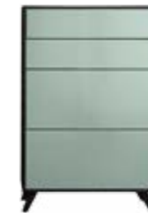
LACK MINT // MINT LACQUER