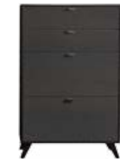
EICHE GRAPHIT // OAK GRAPHITE