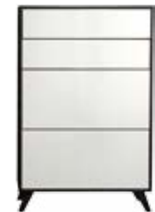
LACK WEISS // WHITE LACQUER