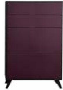
LACK AUBERGINE // AUBERGINE LACQUER