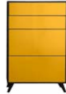
LACK GELB // YELLOW LACQUER