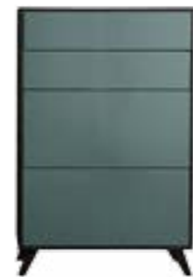
LACK OCEAN // OCEAN LACQUER