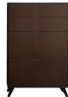
LACK BRAUN // BROWN LACQUER