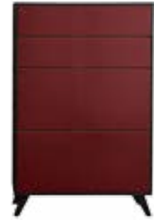
LACK DARK RED // DARK RED LACQUER