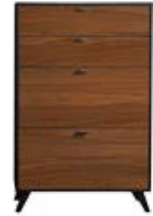
NUSSBAUM NOVA // WALNUT NOVA