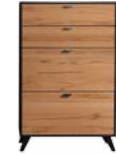
KERNBUCHE* // BEECH HEARTWOOD*