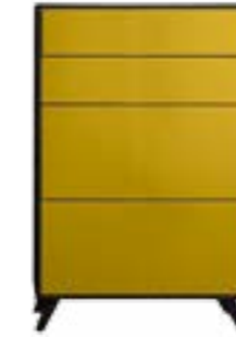
LACK CURRY // CURRY LACQUER