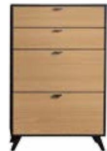
EICHE SAND* // SAND OAK*