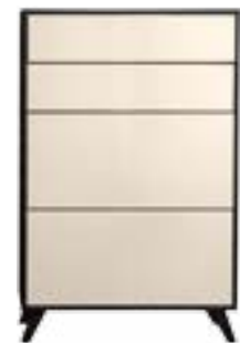
LACK CREMA // CREMA LACQUER