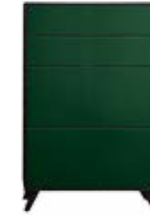
LACK GRÜN // GREEN LACQUER