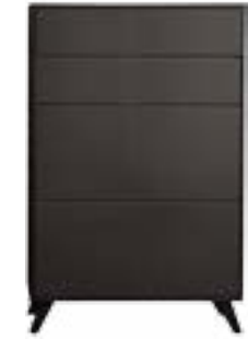
LACK GRAPHIT // GRAPHITE LACQUER