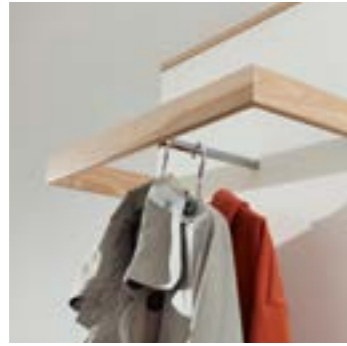
Auch als Designelement ist die Garderobens- stange ein schönes Detail. // The hanging rail is also a beautiful detail as a design feature.