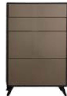
LACK TERRA // TERRA LACQUER