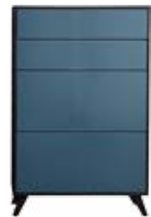
LACK LAGO // LAGO LACQUER