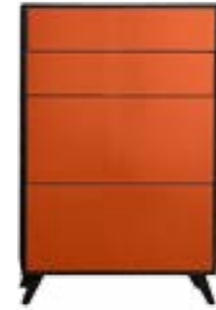
LACK LACHS // SALMON LACQUER