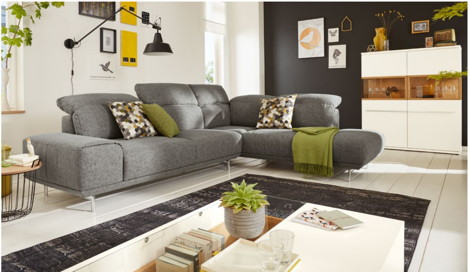
Eckgruppe in Stoff grau bestehend aus Anreihsofa 2-sitzig (N80L) und Ecksofa mit festem Hocker rechts (EG80R), Kopfteilverstellung (KV2, KV3), Metallfuß (F 7P), ca. 300 x 237, H 87, SH 46 cm