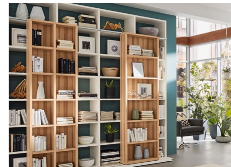
Einbau nach Maß Made to measure