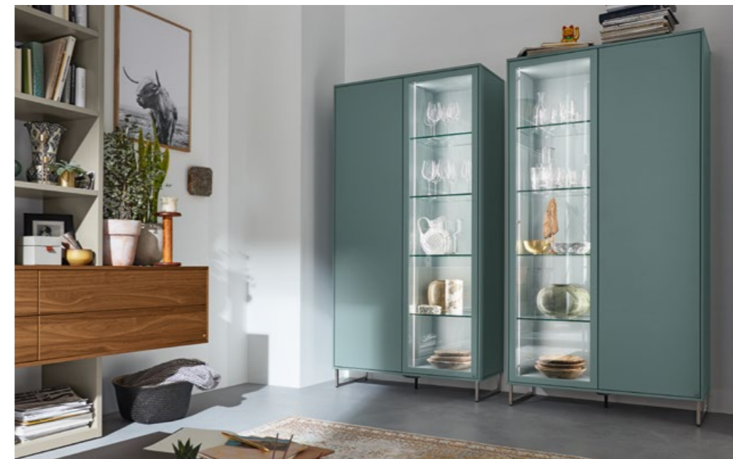
◀ Vitrinen 78584 / 78585 in Lack agave, je ca. B 92, H 191, T 40 cm

Display cabinets 78584 / 78585 in agave lacquer, each approx. W 92, H 191, D 40 cm