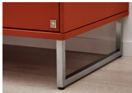
Edelstahlfarbige Kufen-Stellfüße verleihen Ihrem Highboard einen schwebend leichten Look – bei absolut robuster Qualität.