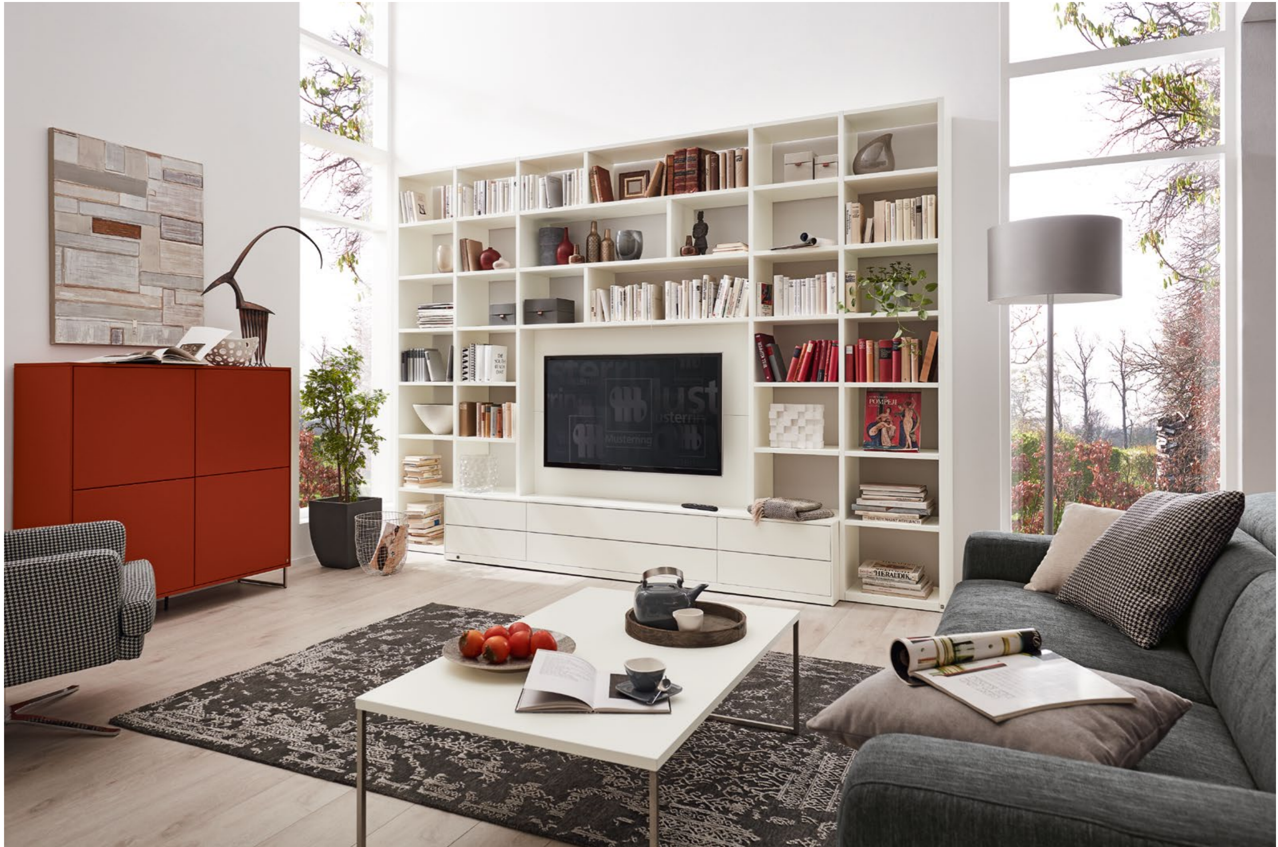
▲ Kommode 78600 auf Kufen in Lack ziegelrot, ca. B 77, H 121, T 40 cm