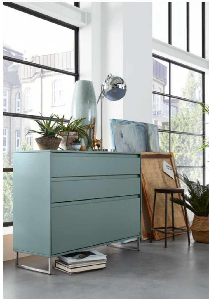
◀ Schuhschrank KARA-FRAME-DIELEN Shoe cupboard KARA-FRAME-DIELEN