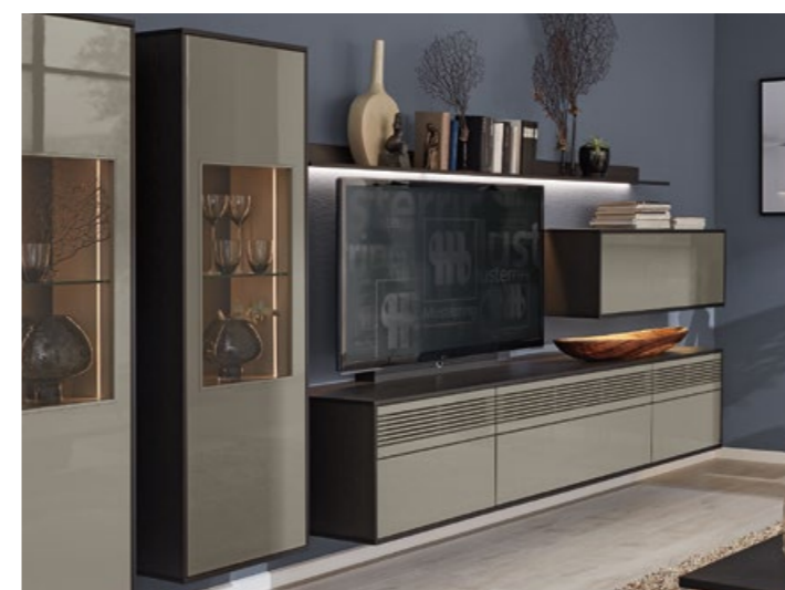
Integration von Sound-Systemen Perfect Sound Inside