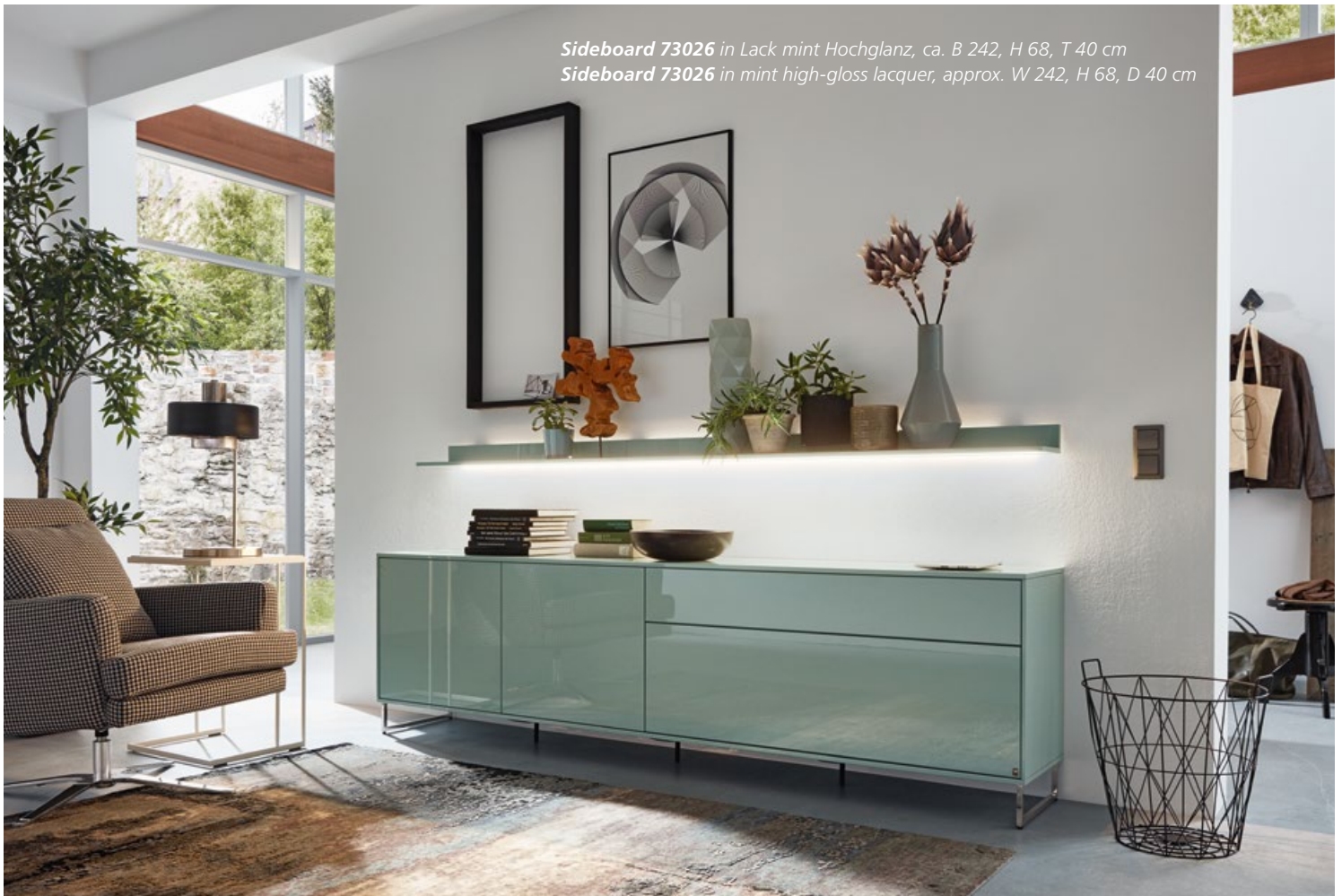
Sideboard 73026 in Lack mint Hochglanz, ca. B 242, H 68, T 40 cm Sideboard 73026 in mint high-gloss lacquer, approx. W 242, H 68, D 40 cm