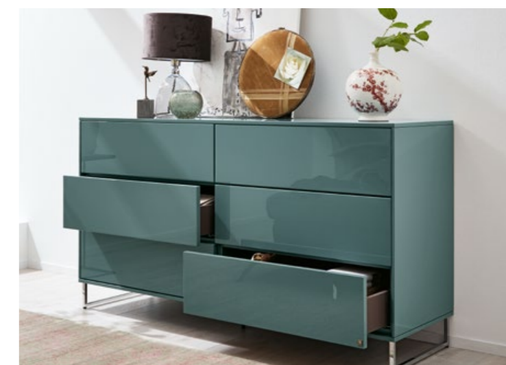
Stauraum Storage space