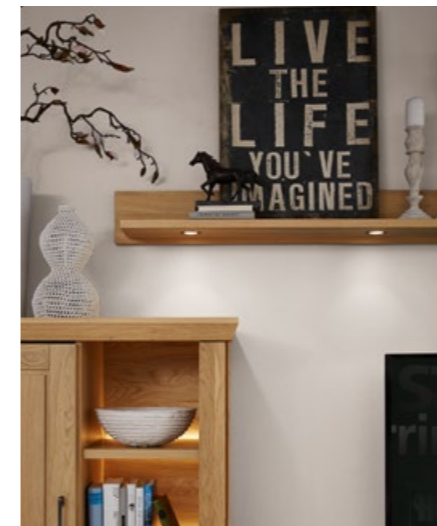
ASCONA in Eiche teilmassiv, gebürstet: Wohnwand 9751, ca. B 370, H 203, T 50 cm; Wandbord 70256, ca. B 165, H 17, T 21 cm; Couchtisch 7702, ca. 115 x 65, H 43 cm