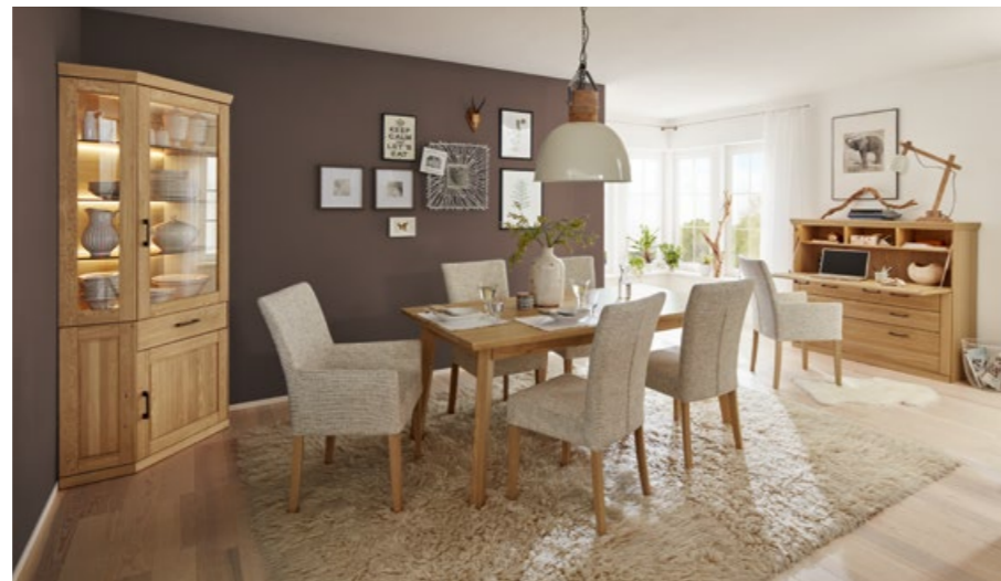
ASCONA in part-solid oak, brushed: Corner display cabinet 7361, approx. W 105, H 203, D 48 cm; bureau 7439, approx. W 137, H 123, D 44 cm; dining table 77476, approx. 160 (210) x 95, H 76 cm; chair 6491, approx. W 44, H 98, SH 49, D 60 cm, SD 44 cm; chair 6492, approx. W 55, H 95, SH 49, AH 64, D 60 cm, SD 44 cm