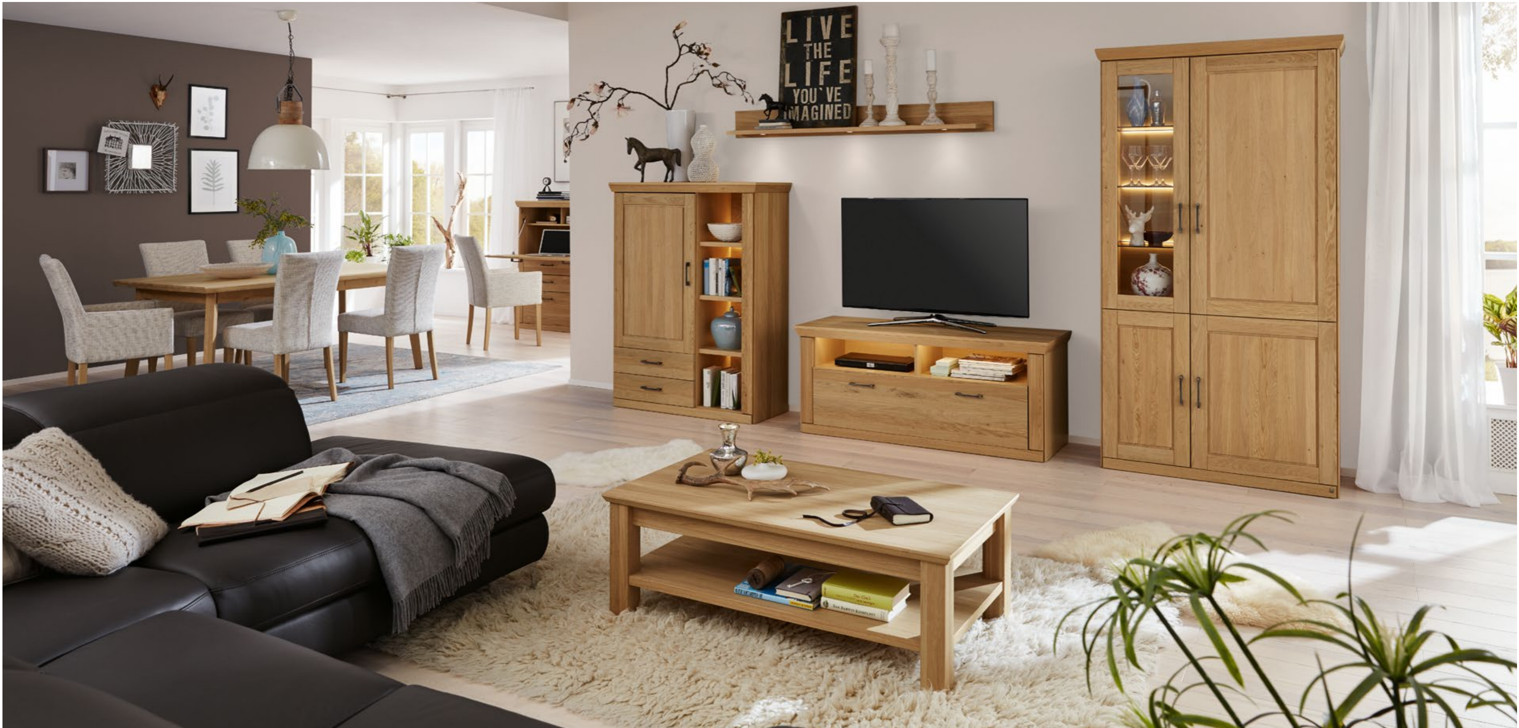
ASCONA in Eiche teilmassiv gebürstet: Eckvitrine 7361, ca. B 105, H 203, T 48 cm; Sekretär 7439, ca. B 137, H 123, T 44 cm; Esstisch 77476, ca. 160 (210) x 95, H 76 cm; Stuhl 6491, ca. B 44, H 98, SH 49, T 60 cm, ST 44 cm; Sessel 6492, ca. B 55, H 95, SH 49, AH 64, T 60 cm, ST 44 cm