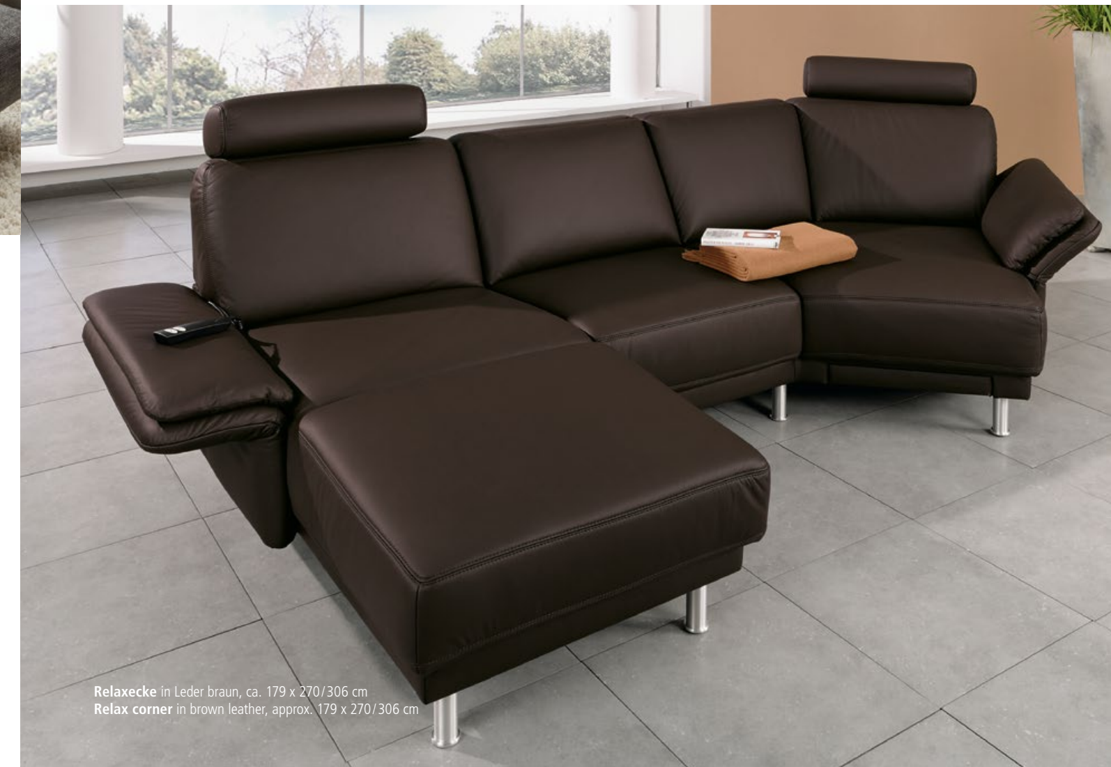
Relaxecke in Leder braun, ca. 179 x 270/306 cm Relax corner in brown leather, approx. 179 x 270/306 cm