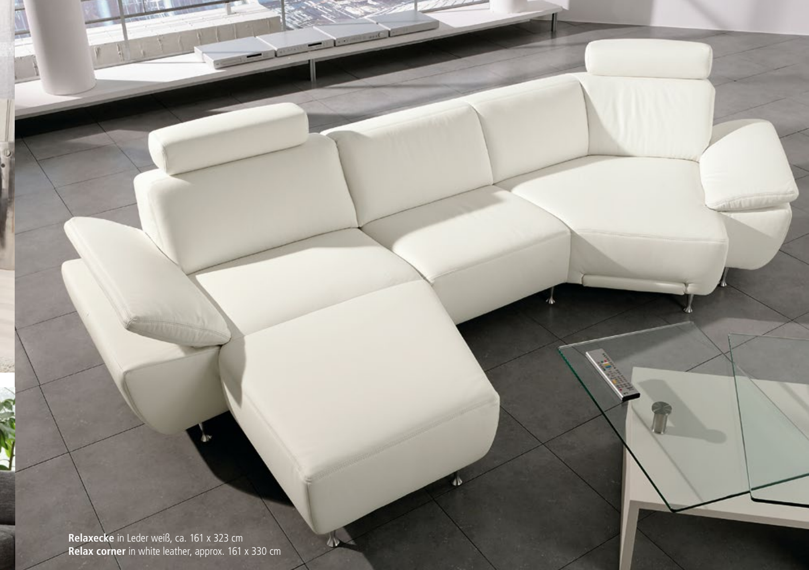
Relaxecke in Leder weiß, ca. 161 x 323 cm Relax corner in white leather, approx. 161 x 330 cm