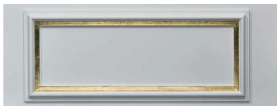
Lack uni mit Hohlkehle Gold Lacquer uni and gold flute