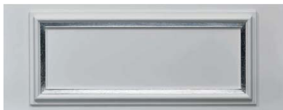
Lack uni mit Hohlkehle Silber Lacquer uni and silver flute

Kannelierte Pilaster Fluted pilaster strips