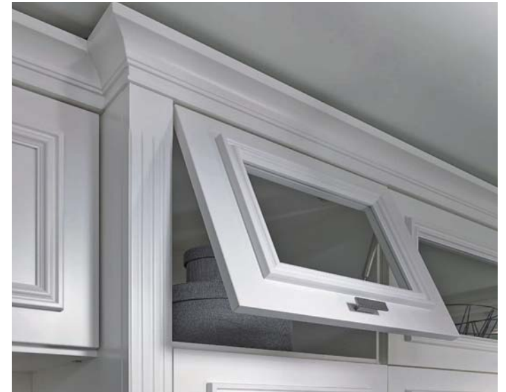
Links: LOGO CLASSIC Handtaschendepot mit Glas in verschieden große Fächer unterteilt, im Raster auch breitenvariabel. Oben: Klappe mit Glaseinsatz nach oben oder unten zu öffnen, auch als komplette Holzklappe, mit Gasdruckdämpfer.