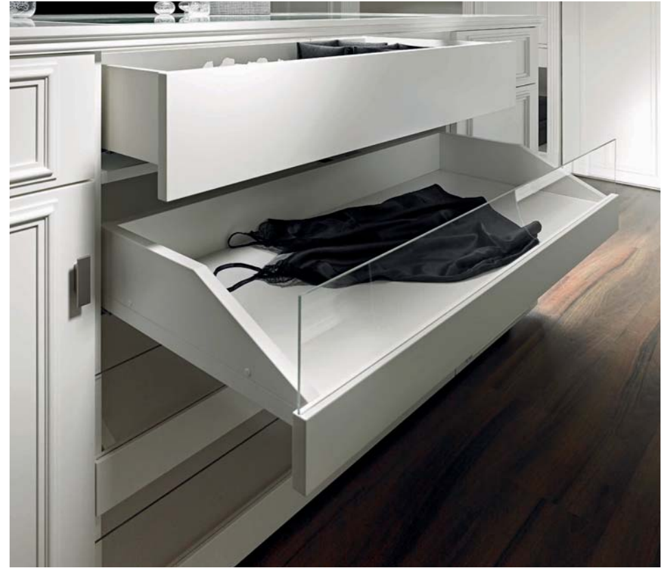
Ausziehboden mit Holz/Glasfront und Push-to-open Technologie. Pull-out shelf with glas inset and push-to-open technology.