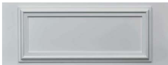
Lack uni Lacquer uni