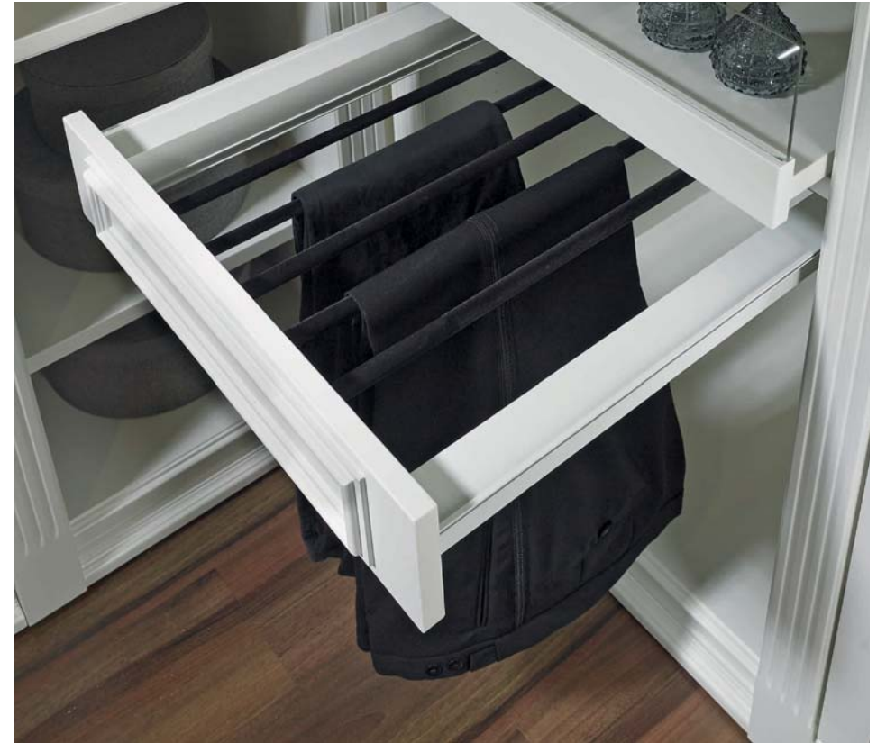
LOGO CLASSIC Hosenauszug mit schwarz beflockten Stangen, breiten- und tiefenvariabel.

Variable drawer division perfectly fitted in particular drawer width and depth, surface silver melamine.