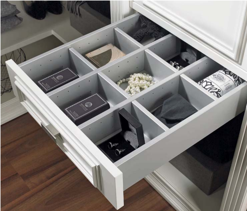
Schubkastenunterteilung variabel und auf die jeweilige Schubkastenbreite und Tiefe zugeschnitten, Oberfläche silber Dekor.

Variable drawer division perfectly fitted in particular drawer width and depth, surface silver melamine.