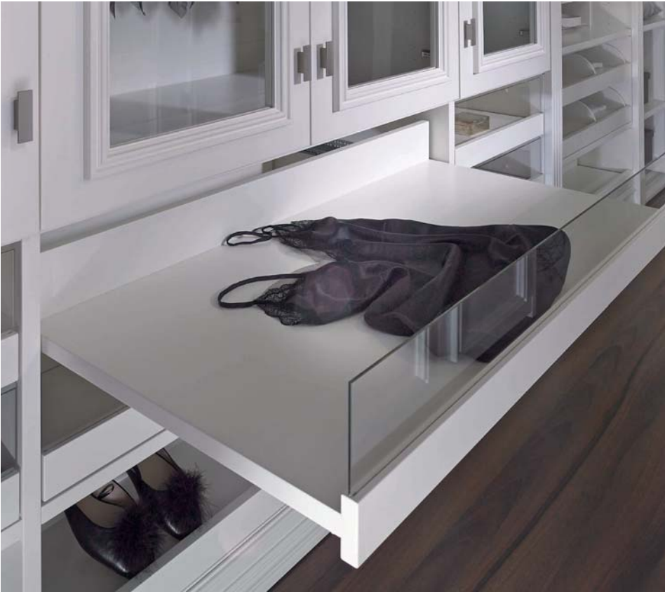
Ausziehboden mit Holz/Glasfront und Push-to-open Technologie. Pull-out shelf with glas inset and push-to-open technology.