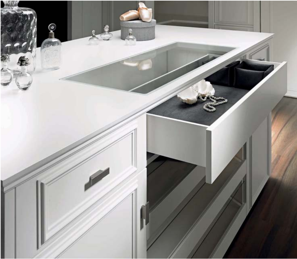
Abdeckplatte der Mittelinsel mit Glasausschnitt und darunter liegendem Schubkasten inkl. Ledereinlage. Island with glass countertop and drawers below, including leather storage inserts.