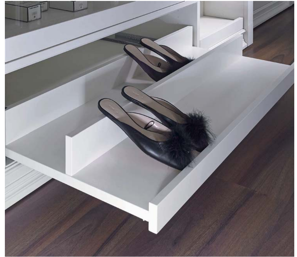
Schuhboden mit Push-to-open Technologie. Shoe shelf with push-to-open technology.