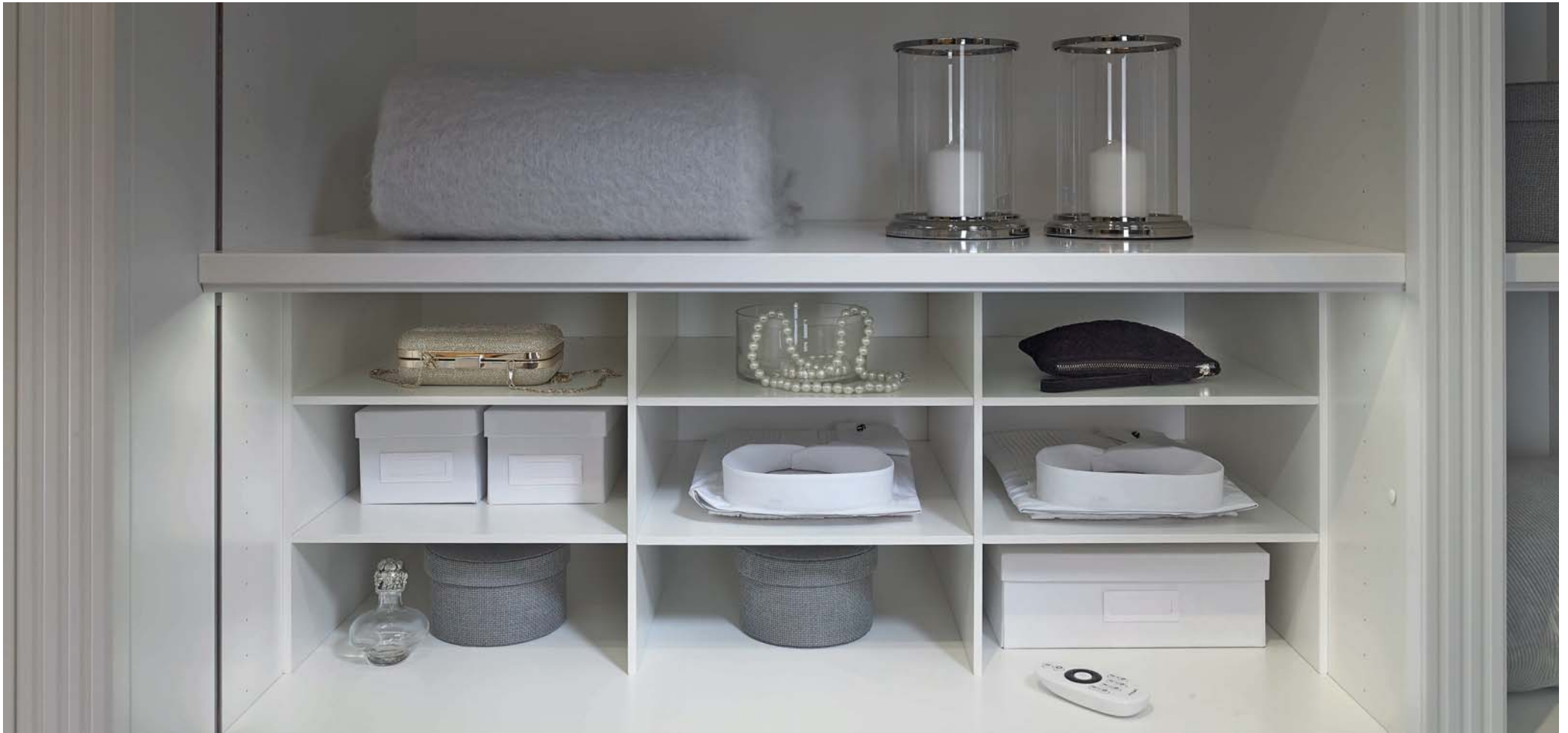
Hemden-/Pullover-Depot zurückgesetzt und mit indirekter Beleuchtung.